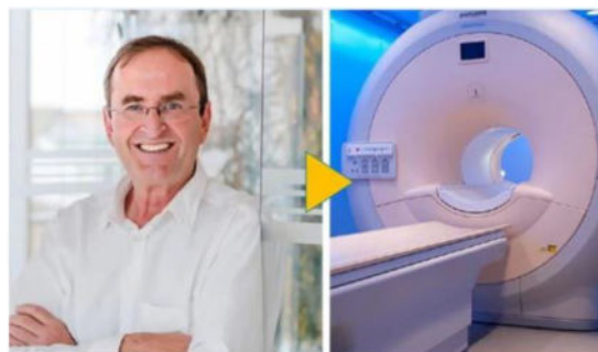
FORTBILDUNG per VIDEO!

Holen Sie sich jetzt Ihr Online-Fortbildungsvideo!